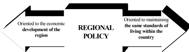
Figure 1. Types of regional policy

There are two types of regional policy (Figure 1). A country, which is suffering from business depression, targets regional policy as the means of economic development. Once the growth in economy has been achieved the priority of regional policy becomes the equalization of standards of living in different regions of the country.